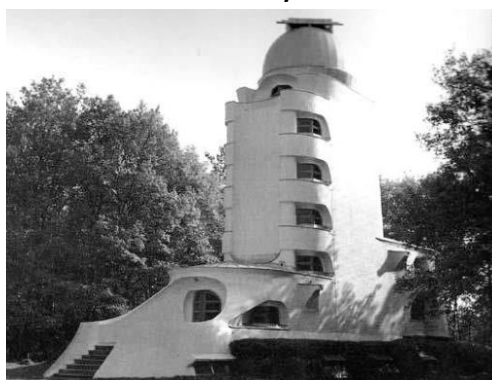
Figura 4: Erich Mendelsohn, Torre Einstein, Potsdam, 1920-21, visivelmente em diálogo com a ideia de movimento de Henry van de Velde.