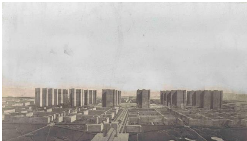
Figura 5: Le Corbusier, Cidade Contemporânea para Três Milhões de Habitantes, 1922.