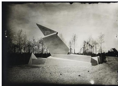
Figura 3: Monumento aos mortos de março, Walter Gropius, 1921, inspirado na forma do cristal.