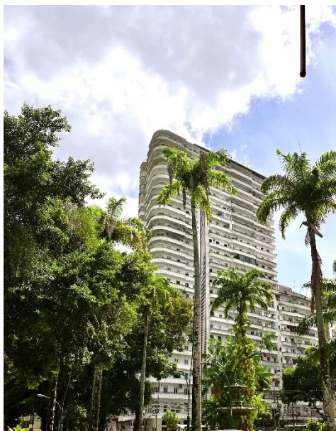
Figura 4: Edifício Manoel Pinto da Silva.

Ratifica-se que os critérios de preservação são complementares. Os critérios não devem ser analisados isoladamente, pois um pode fornecer respostas que algum outro não esteja indicando com clareza. Uma obra como o Edifício Manoel Pinto da Silva (Figura 5), um marco da modernidade de Belém, cujas linhas figurativas o aproximam das expressões do art déco , não pode fixar apenas critérios formais para justificar seu valor. Um deles é o valor referencial daquele edifício. Isto porque, determinados edifícios são tão cristalizados na paisagem da cidade que, se alterados, seriam perceptíveis para aqueles que os têm como referência.