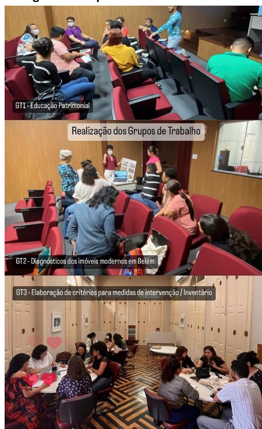
Figura 3: Grupos de Trabalho do Fórum.