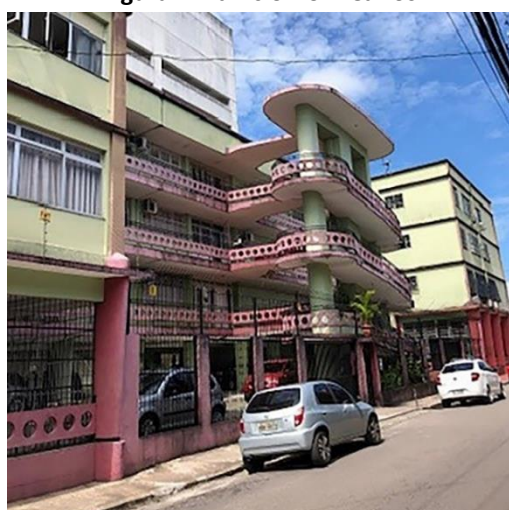
Figura 2: Edifício Dom Carlos.

As primeiras ações para encaminhar processos de tombamento da arquitetura moderna têm início no final da década de 1970. Porém, há um histórico nada animador quanto aos indeferimentos desses pedidos, principalmente obras do engenheiro e arquiteto Camillo Porto de Oliveira, como o edifício Dom Carlos (Figura 2), cuja solicitação de tombamento do ano de 2013 foi indeferida pelos órgãos competentes. O processo de tombamento é extremamente complexo, longo e burocrático, e convém citar que este não precisa ser o único instrumento de salvaguarda patrimonial. Novas abordagens e a constância no uso destes prédios podem contribuir com suas permanências, embora existam diretrizes que necessitam ser adotadas a fim de manter sua manutenção periódica (TAVARES J, 2022).