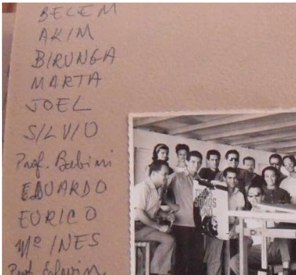
Figura 5: Primeira turma.

As trajetórias e as vidas das mulheres de Brasília ainda precisam ser melhor escritas, é importante reconhecer o papel de cada uma delas. E o mais importante é entender o lugar que cada um ocupa na sociedade. Se fossemos traçar uma cronologia (BLAY; AVELAR, 2017) histórica do feminismo contando a vida delas, perceberíamos que várias nasceram nos anos 1930, e portanto, tiveram direito a voto. Sabemos que os anos de 1960 foram os anos formação das insurgentes, enquanto as nossas candangas invisíveis eram as personagens de Carolina Maria de Jesus que publica no mesmo ano o livro Quarto de despejo , que relata o cotidiano das mulheres pobres residentes numa das primeiras favelas de São Paulo. Boa parte delas era casada e segundo a LEI Nº 4.121, DE 27 DE AGOSTO DE 1962 – que dispunha sobre a situação jurídica da mulher casada: no seu Art. 240: “A mulher assume, com o casamento, os apelidos do marido e a condição de sua companheira, consorte e colaboradora dos encargos da família, cumprindo-lhe velar pela direção material e moral desta”. Ou seja, em 1960, a condição feminina, ora estava atrelada a um homem, ora era vítima de opressão.