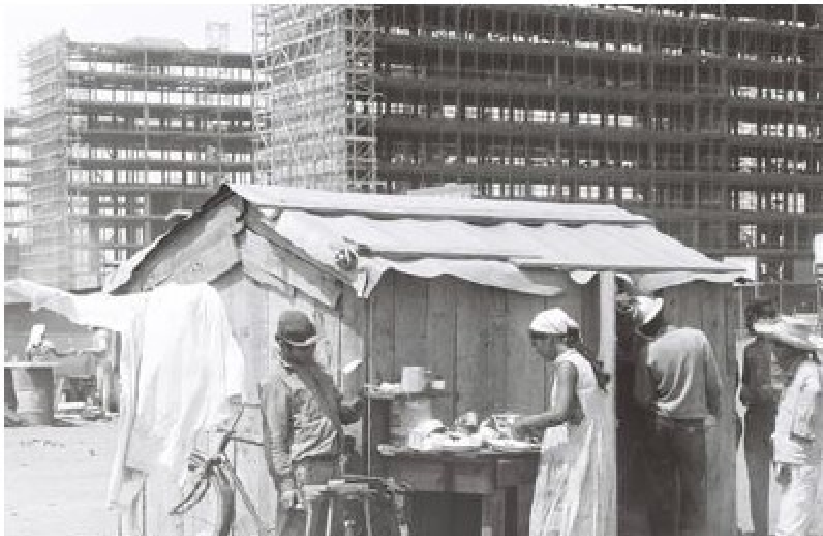
Figura 1: Cantina - Pequenos locais para o comércio de alimentos surgiram no canteiro de obras da Esplanada dos Ministérios.